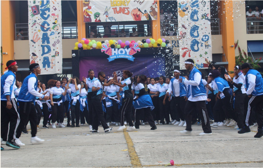
Estudiantes de 6to

Los estudiantes de sexto grado del Centro de Excelencia Salesiano Prof. Liduvina Cornelio llevaron a cabo la hermosa presentación de su lanzamiento de promoción el pasado 21 de marzo del año en curso. Según los espectadores, la actividad fue todo un éxito.