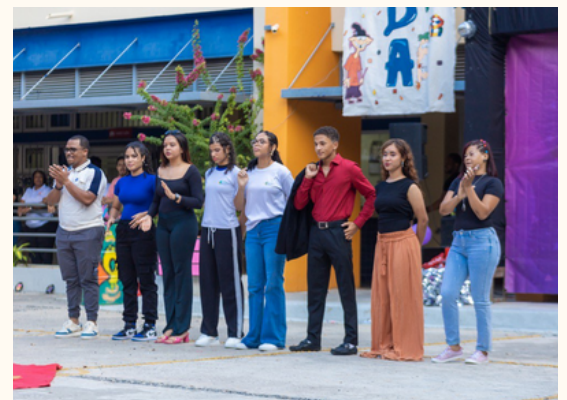
Parte de la comitiva de JECXUM

Al finalizar el acto, se expuso el significado de cada color y el porqué fue elegido el nombre “JECXUM” (Jóvenes Excelentes Comprometidos Por Una Meta).